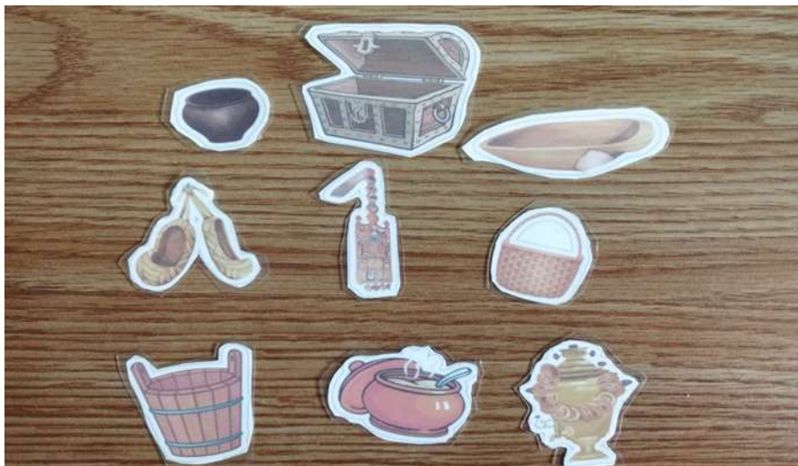
Кармашек «Собери картинку»